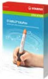
EduPen Schriftanalyse Stift