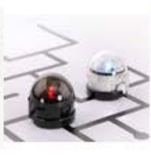
Ozobot Lernroboter für Kinder