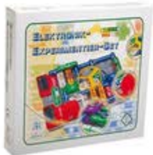
Elektronik- Experimentier- Set