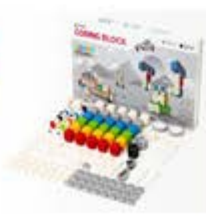
Cubroid - Coding Blocks